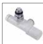
Valvola SLIM termostattizzabile