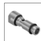
Adattatore G 1/2"