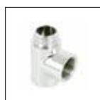
Raccordo a T per resistenza