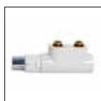
Valvola a squadra con testa termostatica, finitura di design