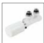
Valvola con testa termostatica