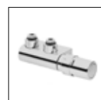
Valvola a squadra VHX-D/RAX