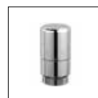
Testa termostatica Optis per valvola SLIM termostattizzabile