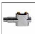
Valvola diritta con testa termostatica, finitura di design