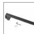
Portasciugamani Ellipse, Ellipse E, Impulse, Impulse E