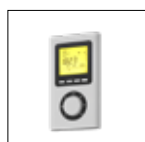
Termostato Ambiente FCIR