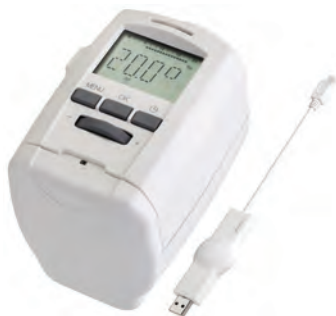
GP 2512 ATTUATORE STAND ALONE

Attuatore cronotermostatico elettronico per installazione su valvole termostattabili da radiatore per la regolazione della temperatura ambiente.