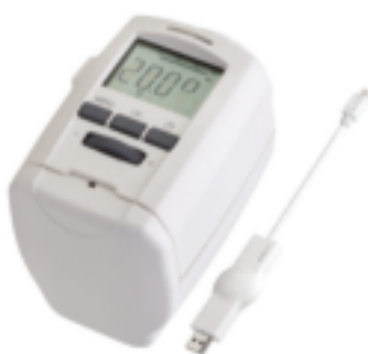
GP 2512 ATTUATORE STAND ALONE

Attuatore cronotermostatico elettronico per installazione su valvole termostatzabili da radiatore per la regolazione della temperatura ambiente.