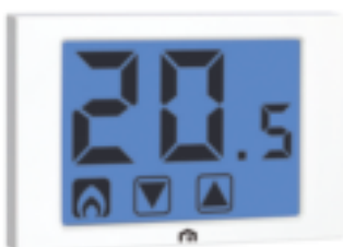
GP 2512 FIV TOUCH EVO

Termostato elettronico touch screen retroilluminato con installazione a parete, progettato per la regolazione della temperatura ambiente sia in modalità riscaldamento (inverno) sia in modalità condizionamento (estate). La tastiera è costituita da due icone poste sulla parte inferiore del display sensibile al tocco (touch screen). Disponibile nelle versioni con alimentazione da rete elettrica o a batterie.