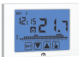
GP 2512 FIV TOUCH EVO

Cronotermistato elettronico touch screen con display retroilluminato, programmazione settimanale ed installazione a parete, progettato per la regolazione della temperatura ambiente sia in modalità riscaldamento (inverno) sia in modalità condizionamento (estate). La tastiera è costituita da quattro icone poste sulla parte inferiore del display sensibile al tocco (touch screen). Disponibile nelle versioni con alimentazione da rete elettrica o a batterie.