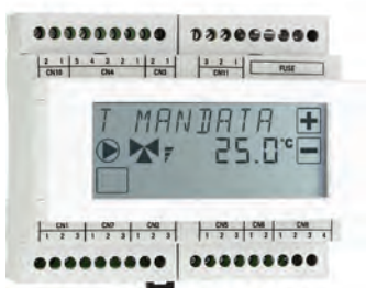
GP 2518 REGOLATORE CLIMATICO