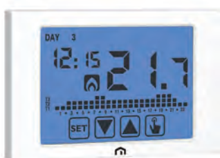
GP 2512 FIV TOUCH EVO

Cronotermistato elettronico touch screen con display retroilluminato, programmazione settimanale ed installazione a parete, progettato per la regolazione della temperatura ambiente sia in modalità riscaldamento (inverno) sia in modalità condizionamento (estate). La tastiera è costituita da quattro icone poste sulla parte inferiore del display sensibile al tocco (touch screen). Disponibile nelle versioni con alimentazione da rete elettrica o a batterie.