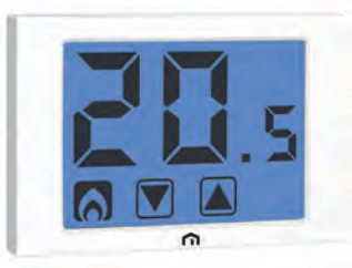
GP 2512 FIV TOUCH EVO

Termostato elettronico touch screen retroilluminato con installazione a parete, progettato per la regolazione della temperatura ambiente sia in modalità riscaldamento (inverno) sia in modalità condizionamento (estate). La tastiera è costituita da due icone poste sulla parte inferiore del display sensibile al tocco (touch screen). Disponibile nelle versioni con alimentazione da rete elettrica o a batterie.